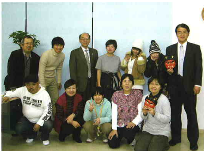
節分祭の後に記念写真を撮る