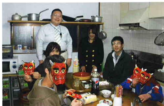
節分に近いある日

しかし、自立援助ホームは退所した後もかかわりを続けていくことのできる場所ではありませんが、生涯住める場所ではありません。そのため「おおもと荘での生活が安定すればそれでいいのか」というとそうではないと思います。まして、ホームを出た後